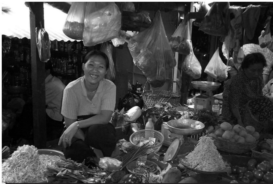
Vendedora ambulante de comida en Tailandia.