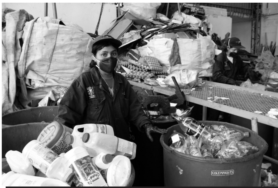
Reciclador clasificando material en el Centro de Reciclaje de Alquería en Bogotá, Colombia.