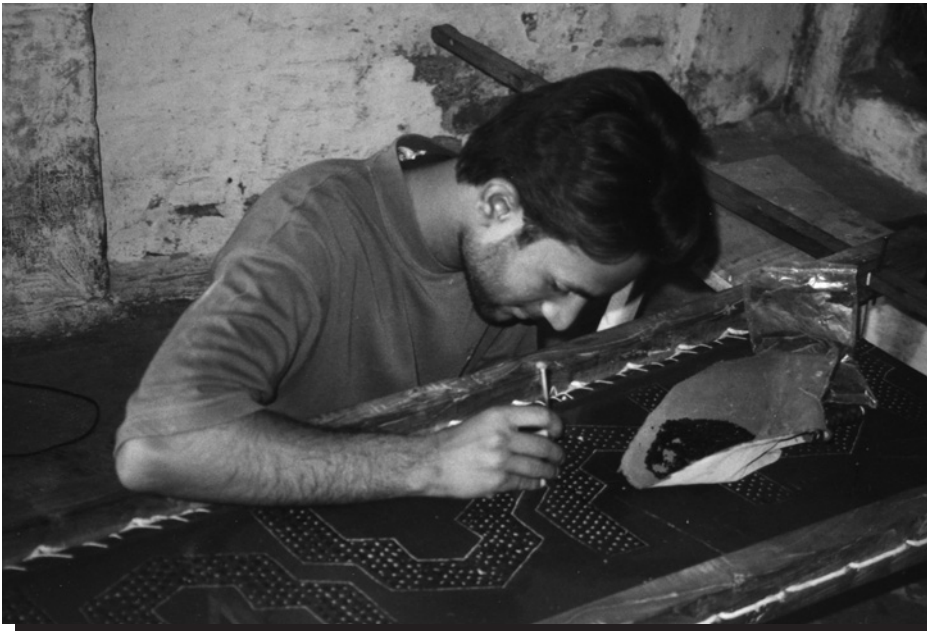
Trabajador a domicilio por cuenta propia bordando en Ahmedabad, India.

Muchos trabajadores de la economía informal viven en asentamientos informales. Los encuestados identificaron la necesidad crítica de mejorar los servicios básicos –vivienda, higiene, agua y electricidad. El no tener servicios básicos intensifica la carga laboral de las mujeres en particular, las trabajadoras informales. Tener servicios básicos deficientes implica que los trabajadores informales y sus familias sean vulnerables a enfermedades. Los ya magros ingresos disminuyen aún más